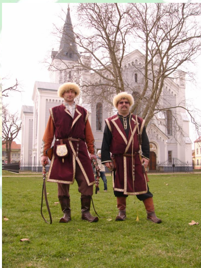
1. Bösörményi Csergetés