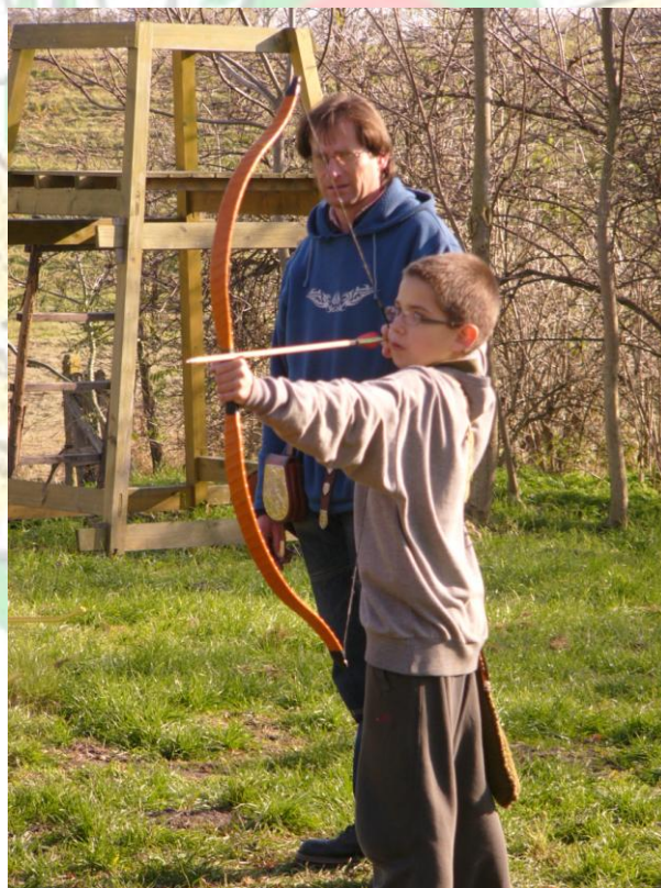
5. Edzés 2