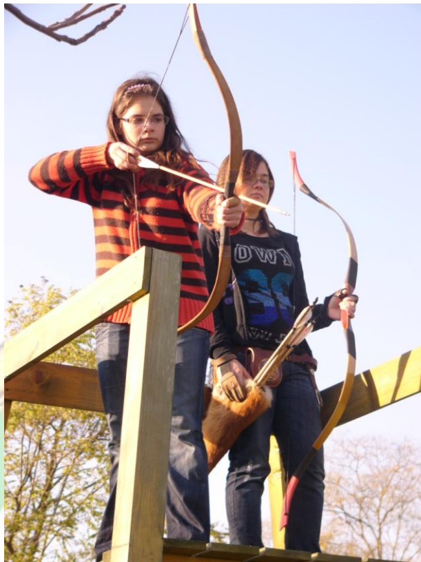
4. Edzés 1